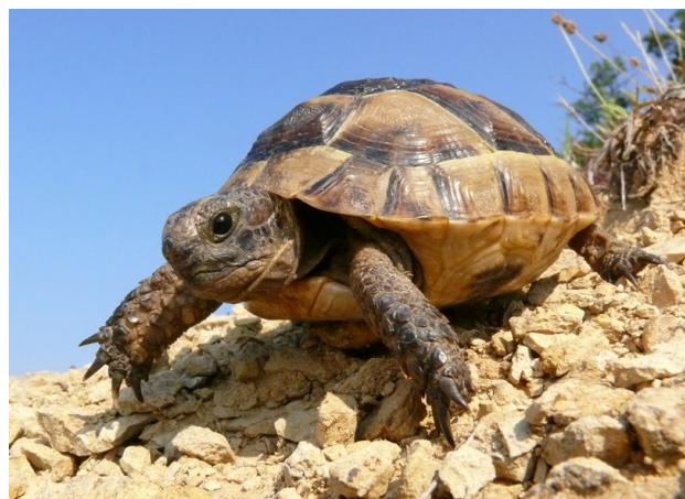
Рис. 4. Ювенильный тип окраски средиземноморской черепахи в возрасте 5 – 6 лет

Окраска абхазских черепах в целом типична для подвида T. graeca nikolskii . Панцирь молодых черепах окрашен преимущественно в желтый цвет, и лишь периферийная часть щитков карапакса – темно-коричневая. Шея, конечности и хвост также окрашены преимущественно в желтый цвет. В целом окраска яркая, контрастная, желтый цвет преобладает по площади над темно-коричневым (рис. 4). С возрастом окраска, как правило, становится более темной и менее контрастной. Это происходит отчасти в результате постепенного нарастания темно-окрашенной периферической части щитков панциря. Исходный желтый цвет также темнеет и превращается в грязно-желтый или светло-коричневый. В целом в окраске взрослых черепах обоего пола преобладают коричневые и бурые тона, соотношение более светлых и более темных участков меняется в сторону темных (рис. 5). Изредка встречаются старые особи, целиком окрашенные в почти черный цвет. Нами был встречен лишь один самец такой окраски. Так же редко встречаются особи, сохранившие