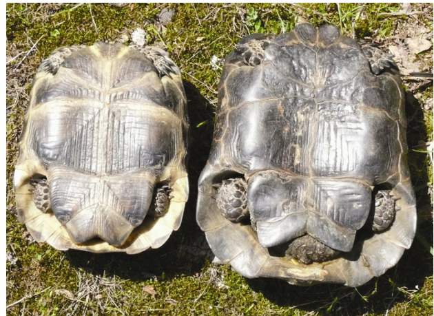
Рис. 3. Половой диморфизм в пропорциях анальных щитков пластрона взрослых средиземноморских черепах (самка – слева, самец – справа)

и в пропорциях анальных щитков пластрона (таблица, рис. 3). Наиболее надежным диагностическим признаком, по нашему мнению, является индекс соотношения длины шва между анальными щитками пластрона и суммарной минимальной ( L_{Pa} : SP 6 ) или максимальной ( L_{Pa} : SP 5 ) шириной этих щитков. В первом случае величина индекса колеблется от 0.23 до 0.42 у самцов; от 0.52 до 0.90 у самок; во втором случае – от 0.22 до 0.32 у самцов и от 0.34 до 0.50 у самок. Таким образом, интервалы значений этих индексов у самцов и самок не перекрываются. Не перекрывается у самцов и самок также значение индекса соотношения длины хвоста и длины шва между анальными щитками пластрона ( L_{caud} : L_{Pa} ). Единственным недостатком использования этого индекса в качестве диагностического признака является сложность (субъективность) относительно точного измерения длины хвоста, который измеряется у живых черепах в подогнутом состоянии. У неполовозрелых черепах в возрасте до 10 лет половой диморфизм практически не выражен.