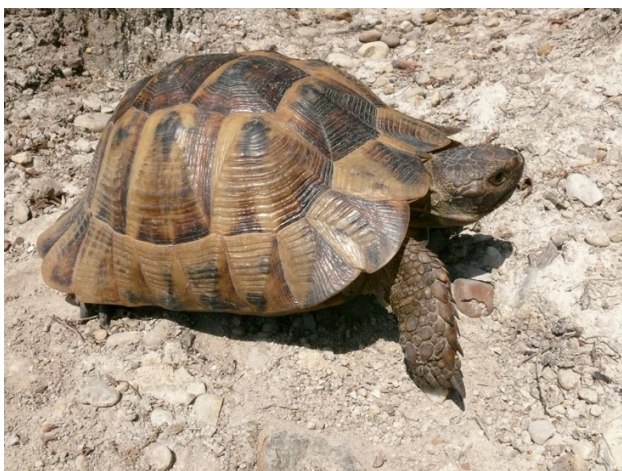
Рис. 5. Типичный вариант окраски взрослой средиземноморской черепахи

В ходе осмотра, измерения и мечения отловленных черепах, практически все они освобождались от каловых масс. В августе 2008 г. мы неоднократно наблюдали утилизацию черепашьих фекалий копрофагами Sisyphus schaefferi (определение д-ра биол. наук Г.А. Ануфриева), которые подобно скарабеем катают миниатюрные навозные шарики.