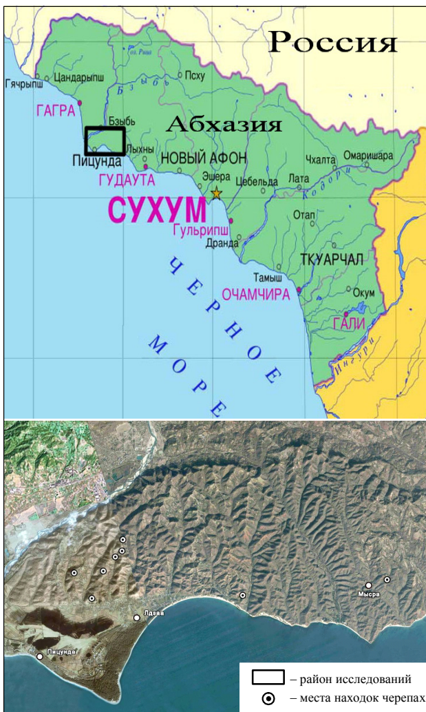
Рис. 2. Современное распространение средиземноморской черепахи в Абхазии

В результате проведенных исследований удалось подтвердить существование устойчивой популяции черепах в Пицунда-Мюссерском заповеднике и на сопредельной территории Гагрского и Гудаутского районов Абхазии (рис. 2).